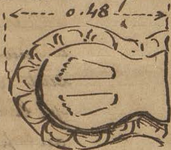
Vue en plan de la pierre de la photo 100

Le dégagement par une équipe de vingt cinq ouliss a porté sur le gopura est de la première enceinte.